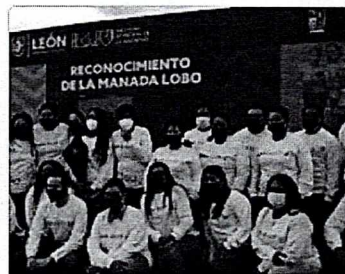
Reconocimiento de la ma...