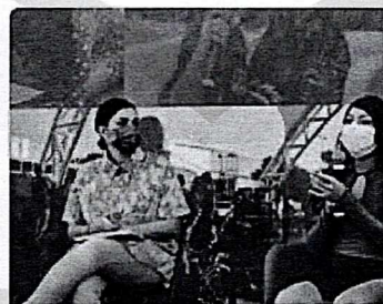
Reconocimiento de la ma...