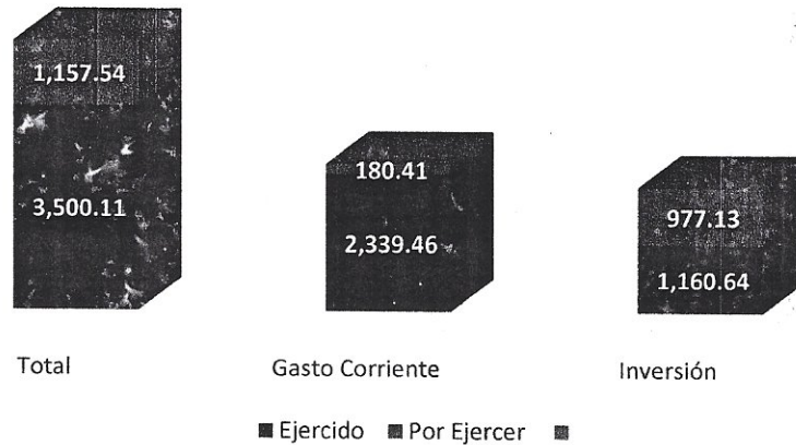
Gráfico 1 Presupuesto Ejercido al tercer semestre del 2017* (Millones de Pesos)